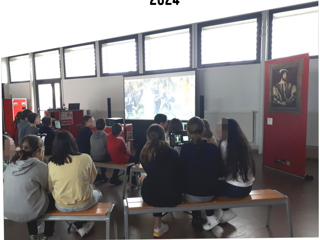
La Micro-Folie au collège Théodore Despeyrous à Beaumont-de-Lomagne à l'occasion de l'exposition «Images du Louvre»