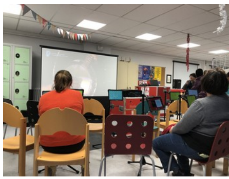
La Micro-Folie déployée dans différents espaces