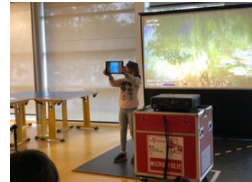
Le mode libre, découverte d'une collection et échange