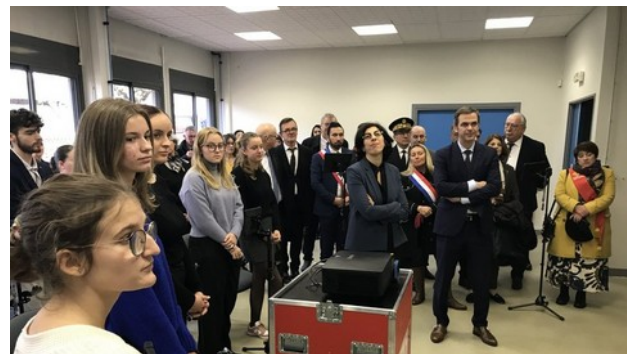
Le parcours «les valeurs de la république et la laïcité à travers l'art» avec des habitants (à gauche) et des lycéens (à droite), sous le regard d'élus de la République