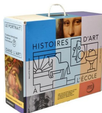
La mallette : le portrait dans l'art