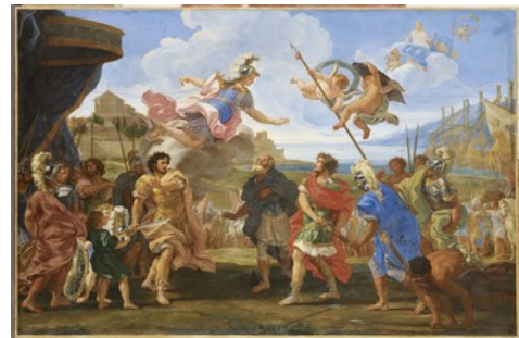
Exemple d'œuvres choisies pour le parcours «La construction des mythes, héros et légendes de l'antiquité»