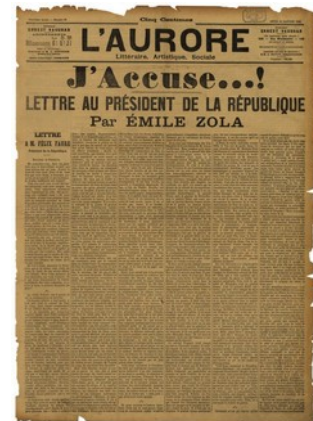
Exemple d'œuvres choisies pour le parcours «Les valeurs de la république et la laïcité à travers l'Art»